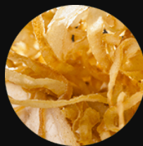
フライドオニオン